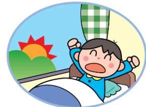
早寝早起き しよう