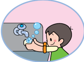
液体せっけん で手を洗おう

そのため冬はインフルエンザをはじめ、風邪や急性胃腸炎などの感染症が流行します。特に乳幼児がかかると重症化する場合もあり、感染症を「予防」していくことが大切です。感染予防に一番有効だといわれているのが手洗い・うがいです。外出後、食事前、トイレ後には手洗い・うがいを習慣つけましょう。園では子どもたちに「あわあわ手洗いの歌」で手洗い指導をしています。ご家庭でも子どもたちと歌いながら楽しんで手洗いの習慣をつけてみましょう。