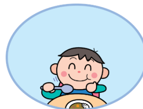
3食しっかり 食べよう