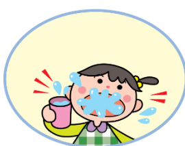
がらがら・ ぶくぶく うがいをしよう