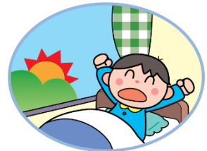
早寝早起き しよう